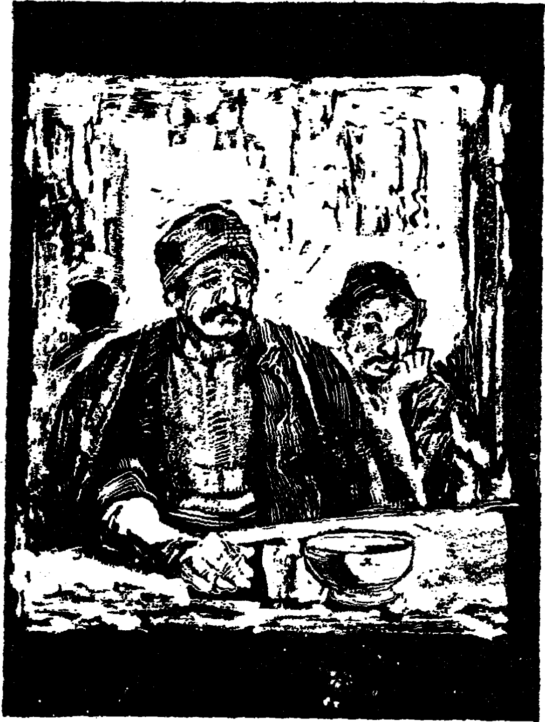
فتظاھر عبد ربہ بالرجولۃ وقال : نالت جزاءھا